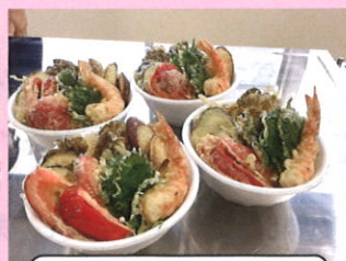
米粉を使った天丼