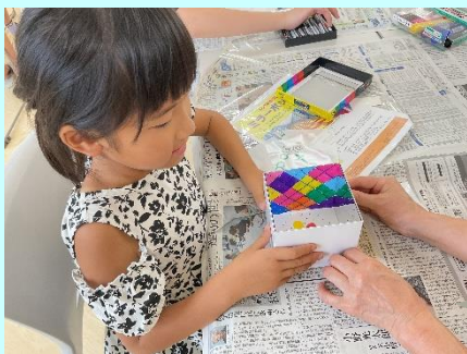
▲ミラーボックス作り