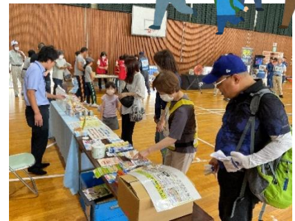
非常時グッズの展示