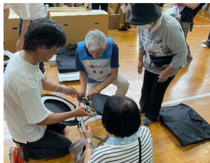
簡易トイレの組み立て