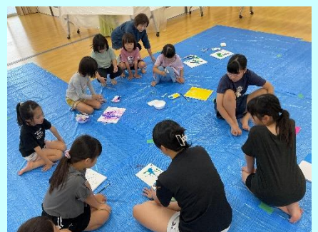
▲アクティブアート

毎回あっという間に時間が過ぎていくアトリエ工房。集中して取り組んで、素敵な作品を作っています☆彡