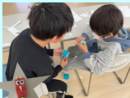
▲毛糸で鳥さん作り