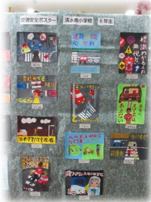
交通安全ポスター