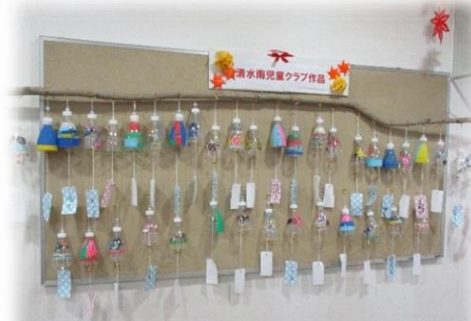
清水南児童クラブ 作品