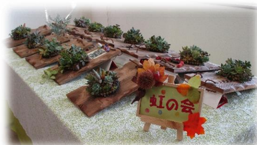
虹の会 多肉植物 ハンキングタブロー