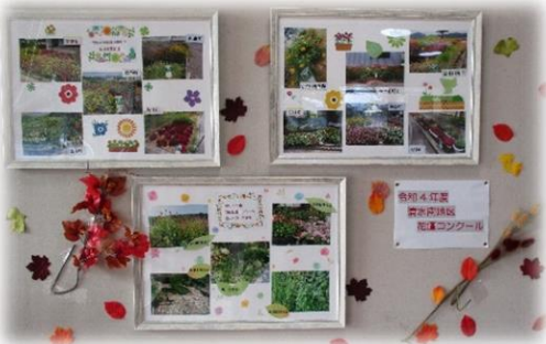
花壇コンクール報告