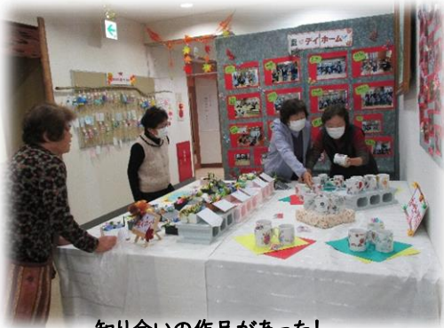
知り合いの作品があった！