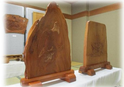
衝立 白頭鷺・ようこそ