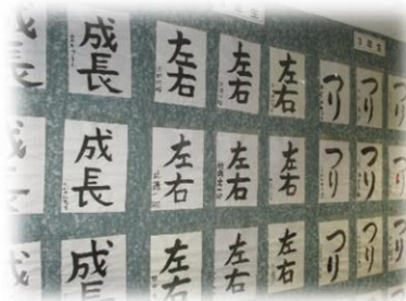
清水南小学校 児童作品