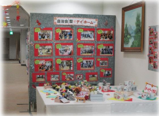
自治会型デイホーム活動報告と作品