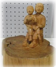
遠い日 お姉ちゃん