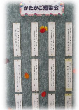
かたかご短歌会 短歌作品