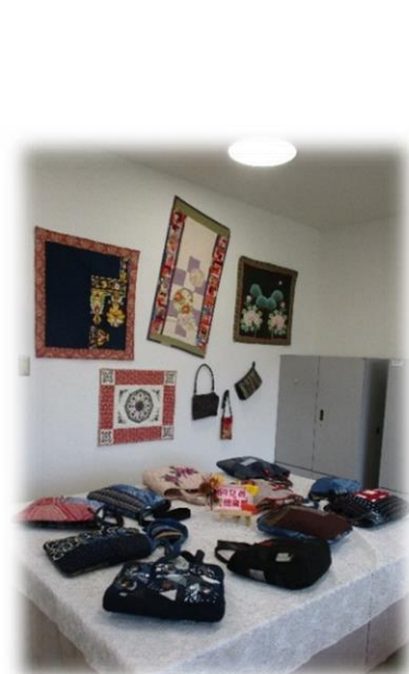
折りひめ倶楽部 作品