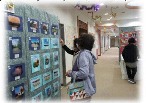
写真コンテスト応募作品