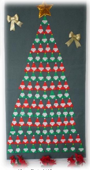
サンタのツリー (折りひめ倶楽部)