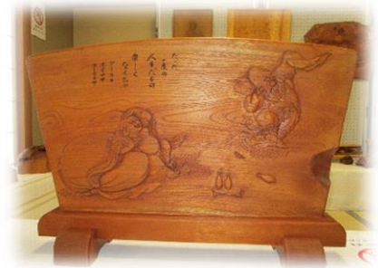
衝立 布袋と寿老の酒宴