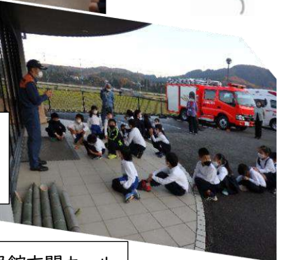
自衛消防訓練 11月17日実施 すばやく避難できました。