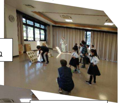
サイエンス教室 空気の重さ感じたね。