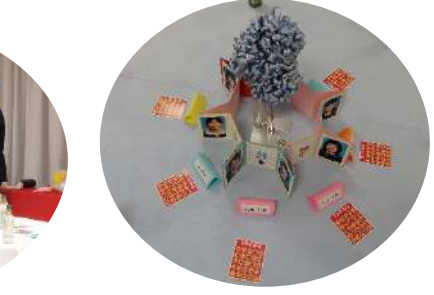
各テーブルには、小、中時代の一人写しの写真立てが星形に並べられました。当日撮影した顔写真を入れて、アルバムと一緒に送付します。