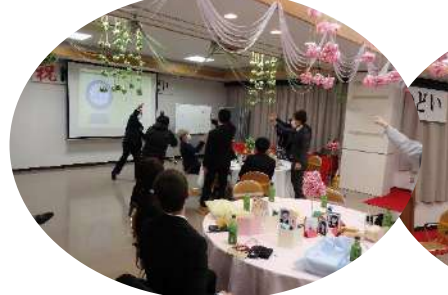
参加者お待ちかね、豪華賞品満載のピンゴゲーム。今年が目玉賞品は、最後の最後まで出ず、館長さんたちとじゃんけんで見事獲得。