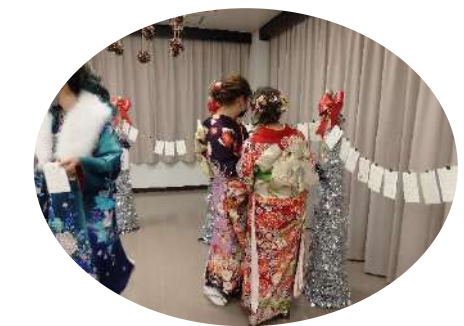
小学6年生の時に送った...20歳の自分へのメッセージはがき