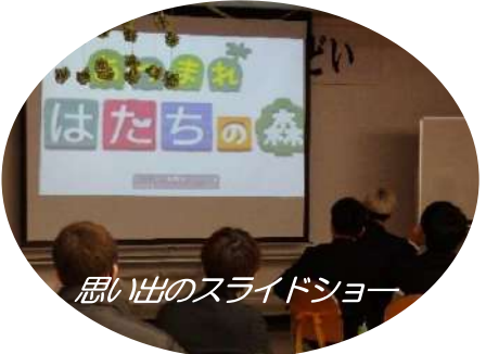
懐かしい顔、かお、顔。思い出がいっぱい。