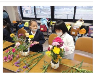
「花育」フラワーアレンジ教室