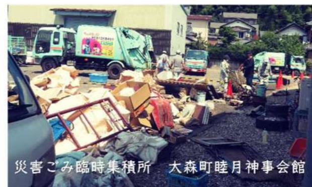
災害ごみ臨時集積所 大森町睦月神事会館