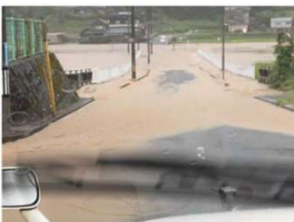
志津が丘3丁目→山内町方面