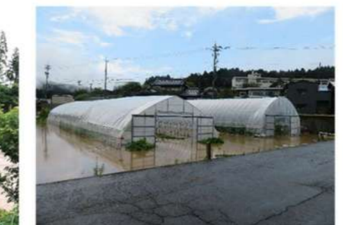
公民館前 ビニールハウス