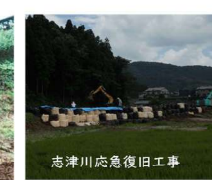
志津川応急復旧工事