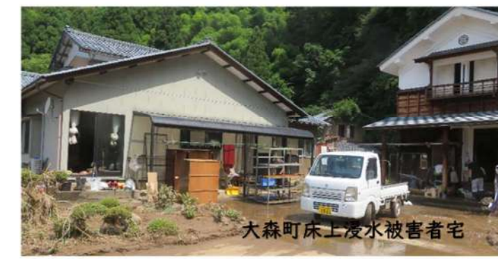
大森町床上浸水被害者宅