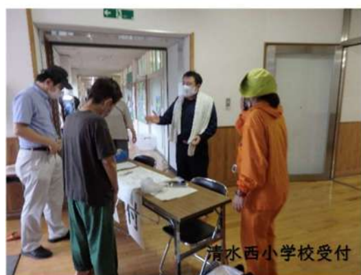
清水西小学校受付