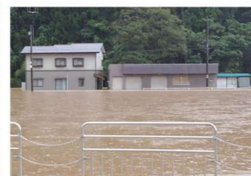
大森町岩坂交差点近く