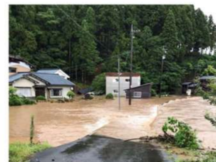
志津川氾濫場所(Yさん宅前)