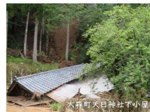
大森町天日神社下小屋