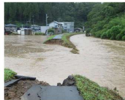
郵便局横志津川堤防決壊場所