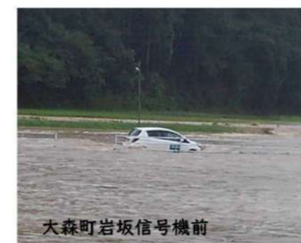
大森町岩坂信号機前