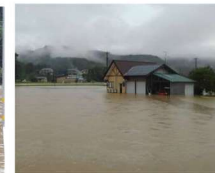
大森町美容室付近