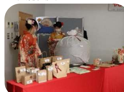
豪華賞品ビンゴゲーム