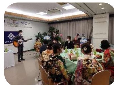
実行委員アトラクション