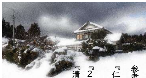
参考文献 『仁愛女子高等学校 百年史』 『20世紀、ふくい群像上』 『清水町史』ほか

詳述できないが笹谷と縁のある仙石家の二階で六名からはじまった学校は徐々に生徒が増えて手狭となったので間もなく宝永上町に移転している。その後「私立仁愛女学校」「仁愛女学校」「仁愛高等女学校」「仁愛女子高等学校」と変遷。初代校長は勿論了教である。