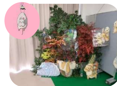
ジブリの森？現れる

今年度の会場は、ジブリの森のイメージでトトロや、ハウルの映画に出てくるような「森」をメインに本物の木を使い自然の中にあるような空間を作りました。実行委員4人による Official 髭男dism の「ノーダウト」の軽快な演奏で開会し、式典後、小学校6年生時に書いた「20歳の自分へのはがき」やタイムカプセル「なめこ」を開け親子で書いた手紙なども読んで今の自分に照らし合わせていたようです。コロナ禍であるため、会食は避け、清水西地区ふるさと創り委員会の方が手作りしたお弁当を手会場を後にしました。