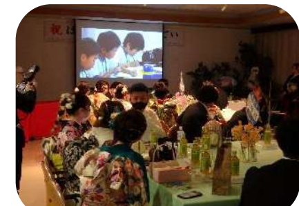
思い出のスライドショー鑑賞