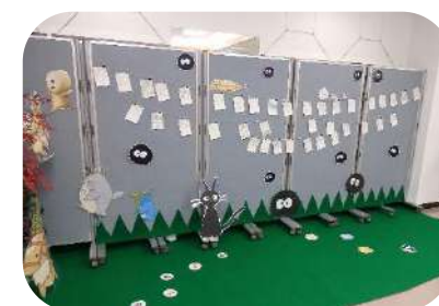
20歳の自分へのはがき