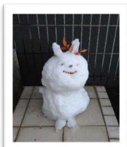
うさぎの雪だるま