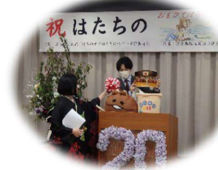
タイムカプセル「なめこ」