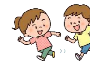
いつも元気いっぱい