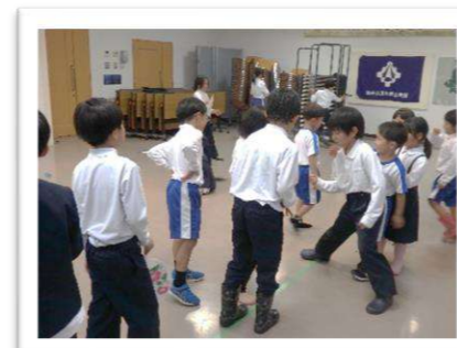
線の上を歩いてじゃんけん!