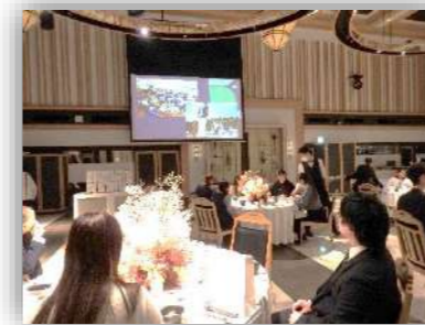
思い出のスライドショー

「清水西地区はたちのつどい 2024」は、八雲迎賓館で開催されました。料理長直々にテーブルマナーを教えていただき、食事もとてもおいしく、楽しいひとときでした。恩師やクラスメートとの再会でゲームや会話も楽しみながらとても有意義な時間を過ごすことが出来ました。小学校6年生の時に書いた「20歳の自分へのメッセージ」のハガキを読み返し、あの頃みていた夢に思いをはせたようです。地区の方々を含む多くの来賓を迎え、はたちの門出を祝っていただき、地域の温かさを感じました。ありがとうございました。(実行委員)