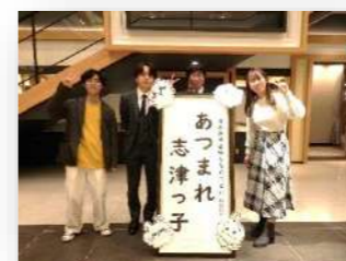
実行委員の皆さん