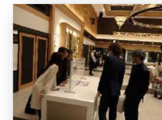
小学6年生時に書いた「20歳の自分へのメッセージ」