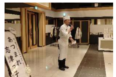
料理長が料理説明&テーブルマナー講習