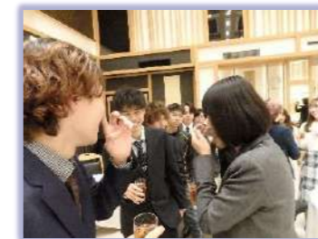
恩師と乾杯&トーク