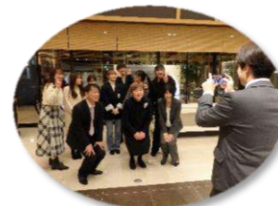
恩師とハイ! チーズ