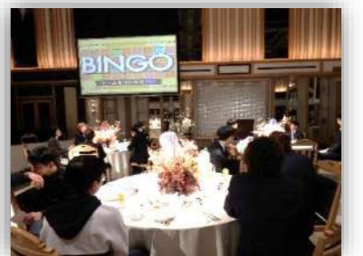
ビンゴゲームで豪華賞品続出!