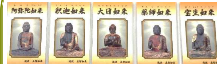
智縁札(五智如来) 智縁札 特許庁商標登録

滝波 ごつつあま会(シニアを中心に五智如来への参拝者誘客や応対、境内・駐車場・周辺環境の整備等を20数名でがんばっています)